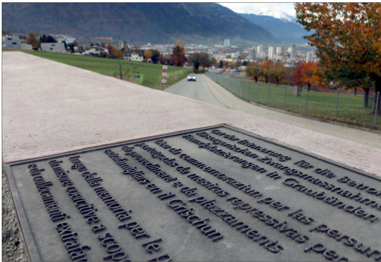
Lieu da commemoraziun a Cuir sper il Fürstenwald.

Sut la direziun da Tanja Rietmann ha in team da perscrutaziun analizà a moda cumplexiva las mesiras repressivas per motivs da provediment. Ils resultats da la lavur da retschertga èn vegnids publicads il matg 2017; dilucidads vegnan tant ils piazzaments administrativs e las avugadaziuns sco er ils piazzaments en in lieu ester ch'èn vegnids decretads